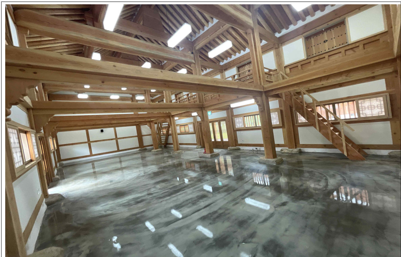
한국문화테마파크 저잣거리-2 현장 사진 2