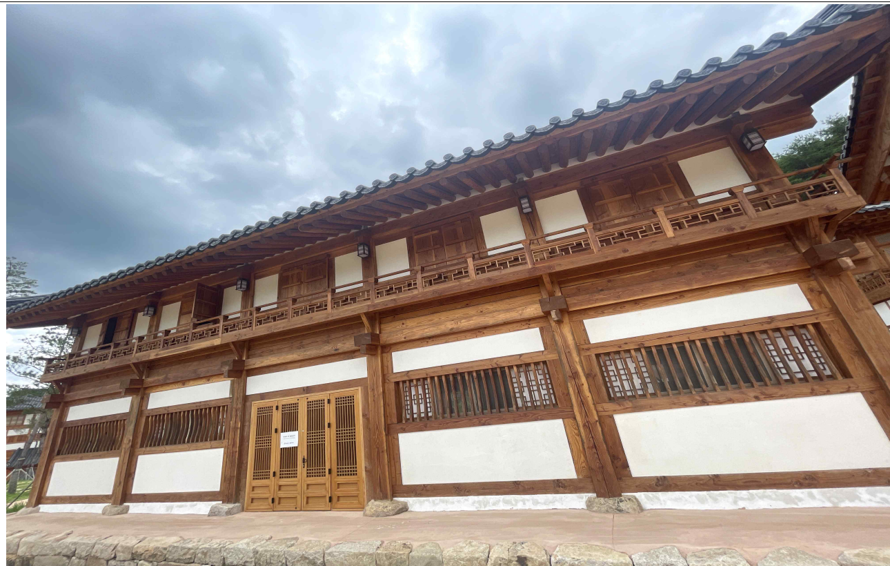
한국문화테마파크 저잣거리-2 현장 사진 1